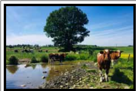
n°1 - DOUET Julien (49)

N'oubliez pas de garder votre appareil photo à portée de main... et pensez à nous envoyer des photos de bonne qualité ! M.C.