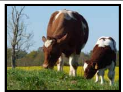
n°3 - CLEMENCEAU Damien (53)