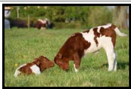
n°2 - MENARD Charlotte (49)